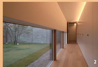
1 廊下からリビングへの視線を遮断し、廊下を曲がった際の驚きを演出。2 一方で芝の緑は視界に入るよう計算されている。