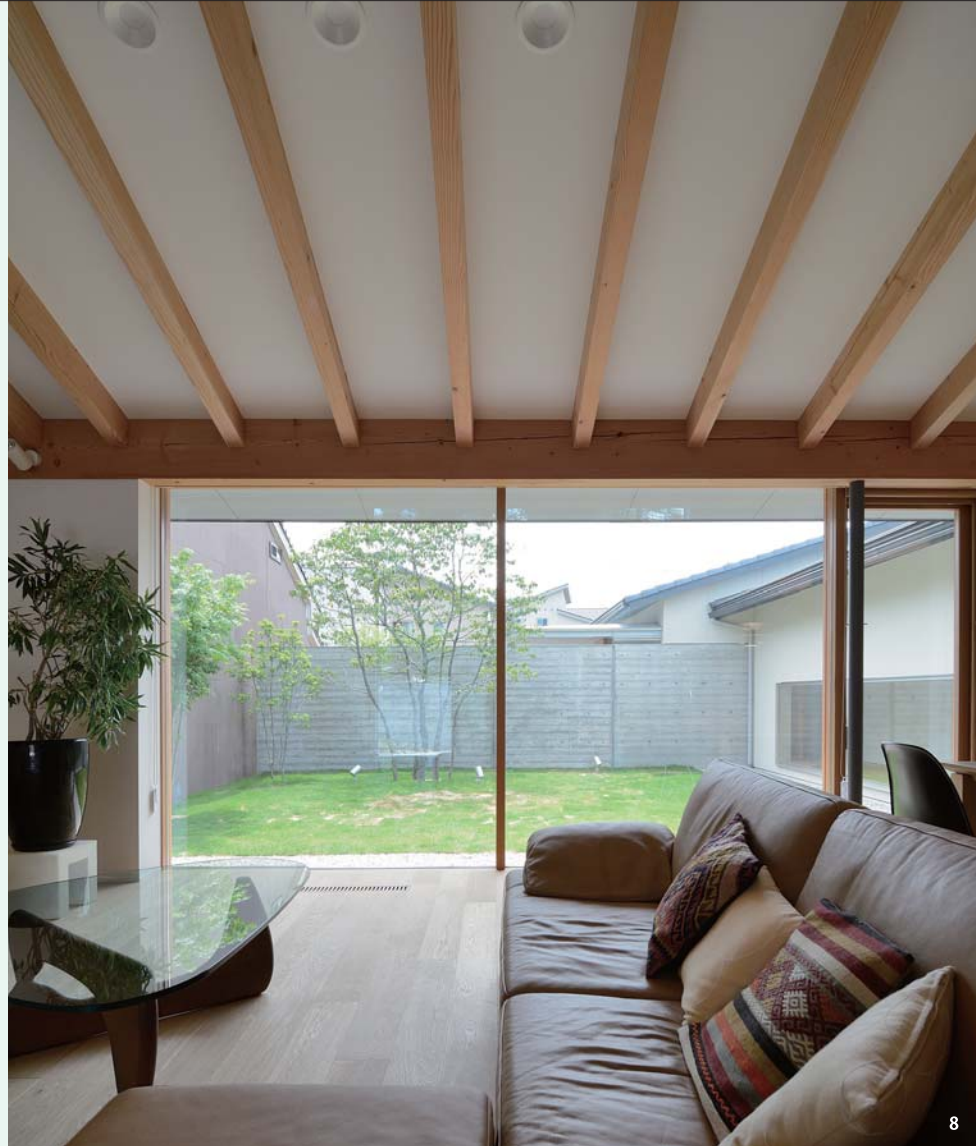
8 家の中から見るコンクリート壁は、床の高さに よって外から見るよりも閉塞感のない印象に。